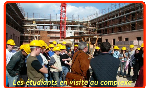
Les étudiants en visite au complexe

La difficulté importante de ce projet a été la période de transition. Il a en effet fallu reloger tous les anciens résidents temporairement, ce qui n'était pas aisé. C'est un point qui a été traité avec beaucoup d'attention et qui a donc pris beaucoup de temps.