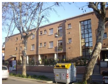
Le complexe vu de la rue Pascoli

Le nouveau complexe, inauguré en 2006 , est lui aussi destiné à une population précarisée. Les aménagements qu'il comporte en font aujourd'hui un lieu d'habitat très agréable et adapté. En effet, 9 de ses 122 appartements sont aménagés pour les personnes à mobilité réduite. Un petit parc et une salle polyvalente au centre du « C » que forment les immeubles permettent de réunir les résidents. Une association d'aide à la personne implantée sur place y organise des activités à destination des personnes seules et âgées. L'alternance d'espaces ouverts et couverts permet l'organisation d'une grande diversité d'activités pouvant faire participer également les habitants du quartier.